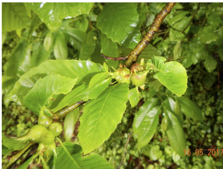
Рисунок 4 – Свежие галлы орехотворки каштановой восточной, 2-я генерация после обнаружения этого карантинного вида в России

На северном макросклоне, в долинах рек Цица и Курджипис, зафиксировано прогрессирующее сокращение количества живых растений самшита в его известных популяциях (URL: http://czl23.ru/news.php?extend.228 ). Здесь площадь очагов увеличилась на 69,3 га и к концу июня 2017 года составила 340,2 га. Очевидно, что эти данные неполные, в первую очередь из-за труднодоступности некоторых массивов самшита (рис. 3). В результате продолжения полевых наблюдений на Лаганакском и Гуамском хребтах очаги самшитовой огнёвки могут увеличить в несколько раз к октябрю текущего года.