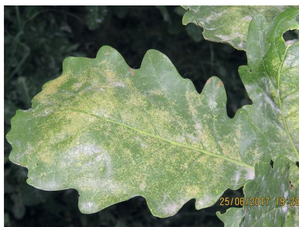
Рисунок 1 – Массовое размножение кружевницы дубовой: экзувии личинок и свежие имаго генерации 2017-1 (а); дехромация дуба к моменту завершения питания личинок генерации 2017-1 (б)

В 2017 году в лесах в границах Краснодарского края зафиксирована активность генерации 2017-1 (первой) текущего года опасного чужеродного вида насекомых-вредителей – клопа кружевницы дубовой (рис. 1). Впервые в лесном фонде инвайдер был выявлен специалистами Филиала ФБУ «Рослесозащита» – «ЦЗЛ» Краснодарского края в 2016 году (URL: http://czl23.ru/news.php?extend.197 ). По результатам анализа космоснимков 2015 и 2016 гг., в сопоставлении их с наземными наблюдениями ГЛПМ (натурная верификация), площадь очагов только сильной и сплошной дехромации (хлороза) дубрав кружевницей дубовой в лесном фонде на территории Краснодарского края к концу 2016 года составила 334055,4 га. Они