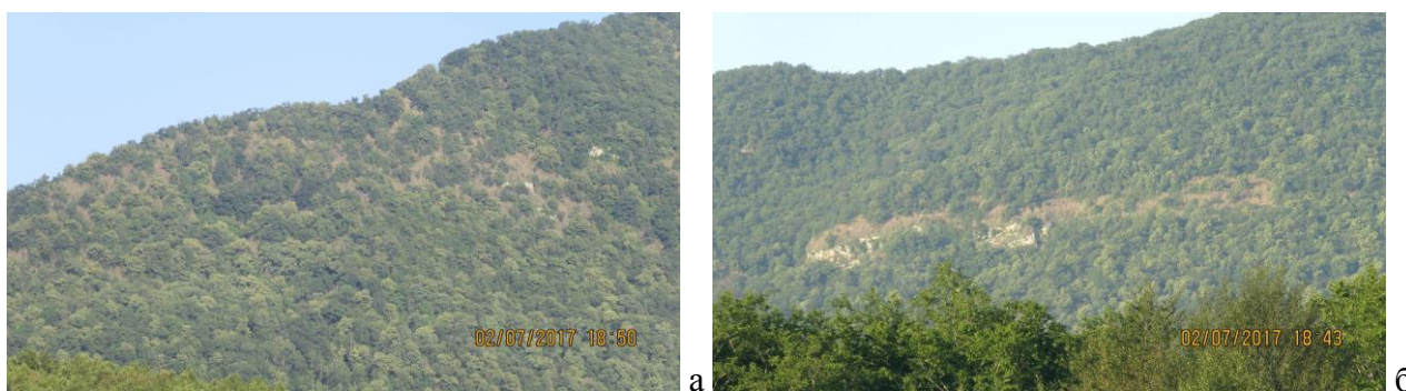
Рисунок 3 – Прогрессирующее размножение огнёвки самшитовой в Черниговском УЛВ: сплошная дефолиация самшита в составе листопадного леса гусеницами генерации 2016/2017 (а); повреждённый самшитник скальный на фоне дубового-грабового леса (б)

По результатам выборочных наземных наблюдений над санитарным и лесопатологическим состоянием лесов выявлено усиление дехромации дубрав блошаком дубовым (рис. 2). Наиболее заметны следы питания этого вредителя на северном макросклоне, особенно в Краснодарском, Апшеронском и Горячключевском территориальных лесничествах, где степень повреждения дубовых древостоев варьирует от средней до сильной (на опушках – сплошной). Площадь очагов этого вредителя в Краснодарском крае составляет 28783,9 га.