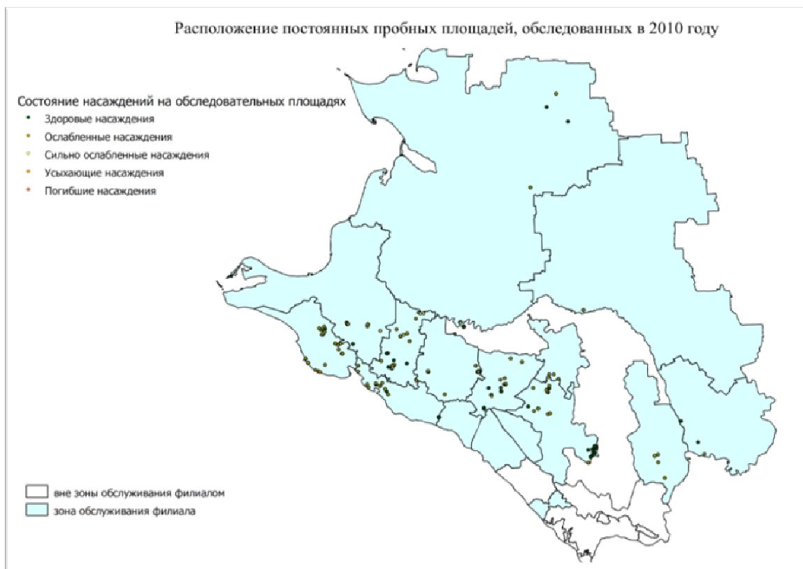
Рисунок Р.1 – Схема расположения постоянных пробных площадей, повторно обследованных или впервые заложенных в 2010 году